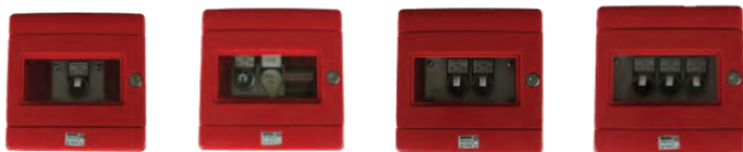
802183D 1 zone 802184D 1 zone 2 coffrets 802185D 2 zones 802186D 3 zones