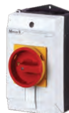
802191D 13A 802192D 32A 802193D 63A